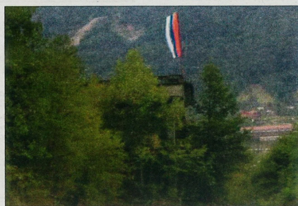
Zastava manjeg bh. entiteta u Srebrenici